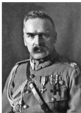
Юзеф Пілсудський (Польща)

Так, у Польщі й Угорщині з'являються політичні лідери, які намагалися вибороти самостійність. Деякі народи — хорвати, словенці, черногорці - об'єднуються довкола незалежної Сербії та створюють згодом єдину державу — Югославію, а чехи зі словаками засновують спільну країну — Чехословаччину.