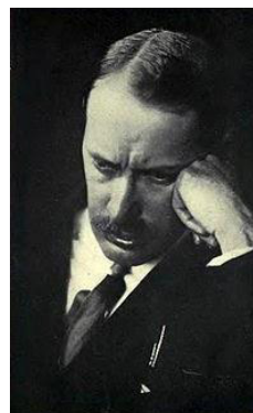
Міхай Карої (Угорщина)