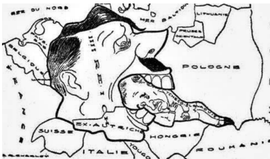
Карикатура «Гітлер поїдає Чехословаччину»

Національний контекст став основою агресивної реваншистської політики Адольфа Гітлера в Європі. Чехословаччина, маючи у своїх володіннях Судетську область, заселену переважно німцями, однією з перших постраждала від рук агресивного лідера Третього Рейху. На цій карикатурі Гітлер, який уособлює Третій Рейх, з'їдає безвольну Чехословаччину в образі її президента Едварда Бенеша.