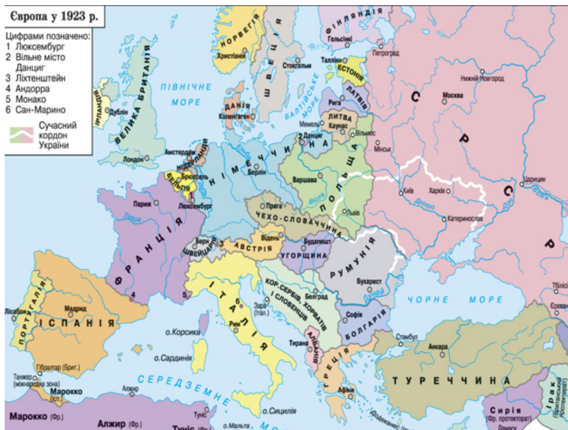
Карта Європи на 1923 р.

шингтонській системі. Фактично лише два великі народи не зуміли здобути незалежність, хоч для того й були доволі сприятливі умови, — це українці та білоруси.