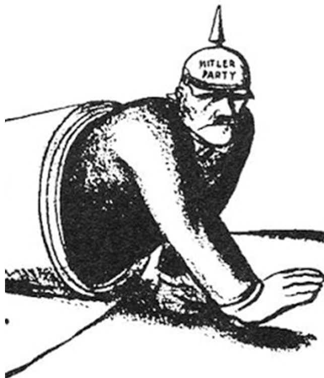
Карикатура «Версальський договір»

Версальсько-Вашингтонська система не була — та й не могла бути — ідеальною. Плануючи новий порядок, тогочасні лідери європейських держав знехтували етнічними кордонами новостворених держав. Це заклало підвалини для майбутніх багаторічних національних конфліктів. Європейські гегемони навіть не здогадувалися, що сокира національного питання повоєнного періоду занесена над головою Європи, і настане час, коли кат покарає їх за таку зухвалу необачність. Він прийде до влади в Німеччині у 1933 році. На цій карикатурі ми спостерігаємо, як із труби з написом «Версальський договір» вилазить чоловік, рисами обличчя схожий на Гітлера. Вона ніби символізує, що Версальсько-Вашингтонська система сама породила свого ката.