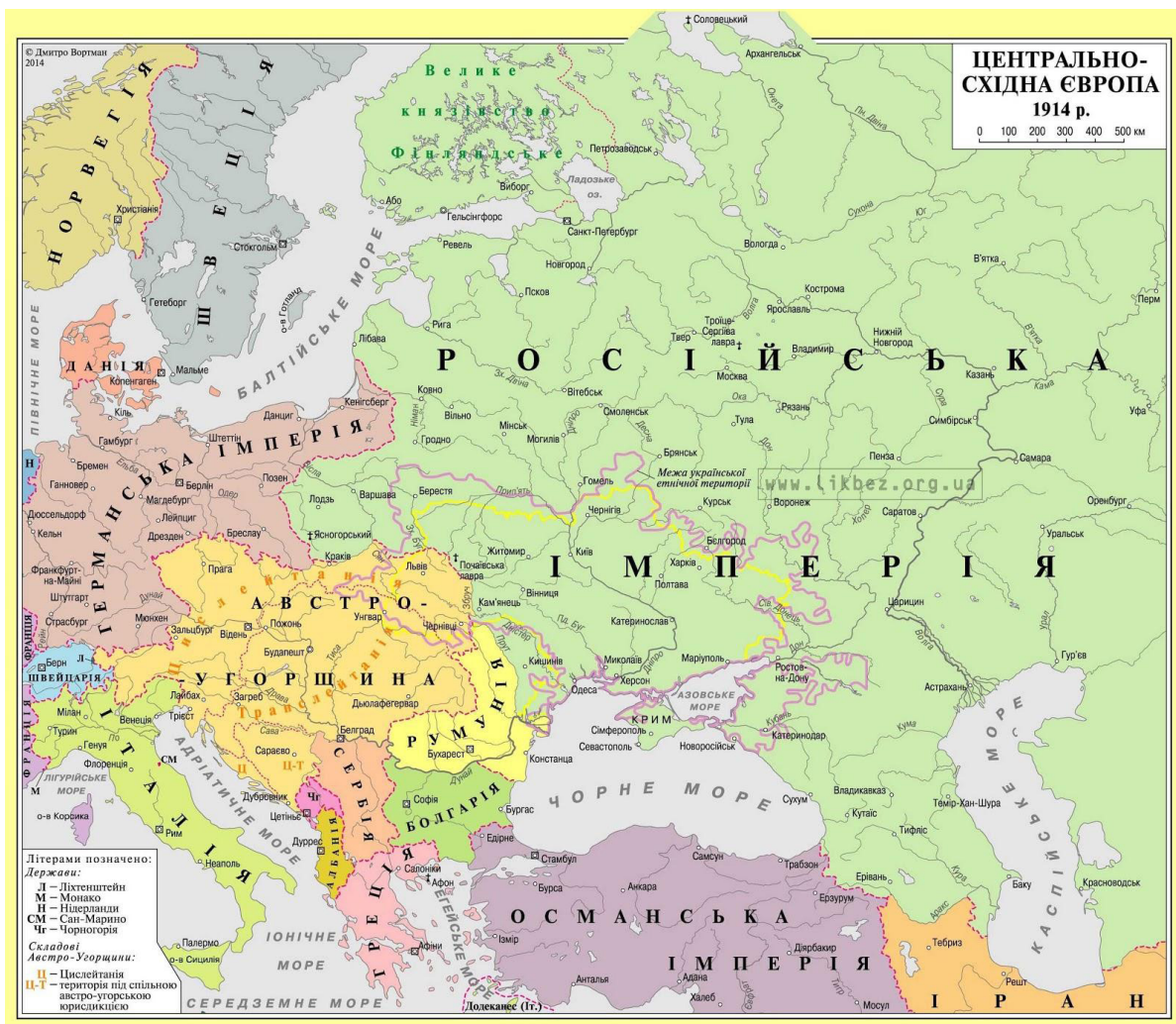
Карта Центрально-Східної Європи на 1914 р.

Цей факт і визначав їхній розвиток. Перебування під владою імперій уповільнило економічний розвиток та загальну модернізацію країн. Вони відстають в економічному плані, оскільки орієнтуються на аграрний сектор і є сировинним придатком потужного володаря.