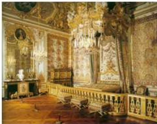
Малюнок 12. Палац Версаль

Віртуальні подорожі цікавими місцями європейських країн