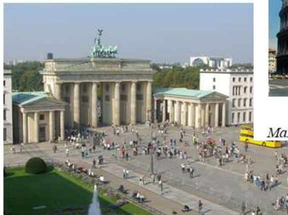
Малюнок 31. Бранденбурзькі ворота