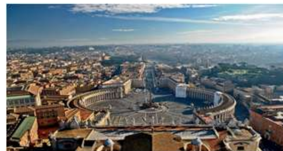
Малюнок 33. Площа Святого Петра, Рим.

Відвідування віртуального музею М.Коцюбинського в м. Чернігові