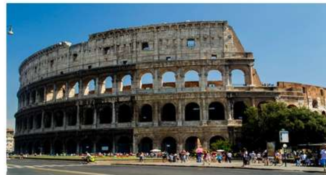
Малюнок 36. Колізей