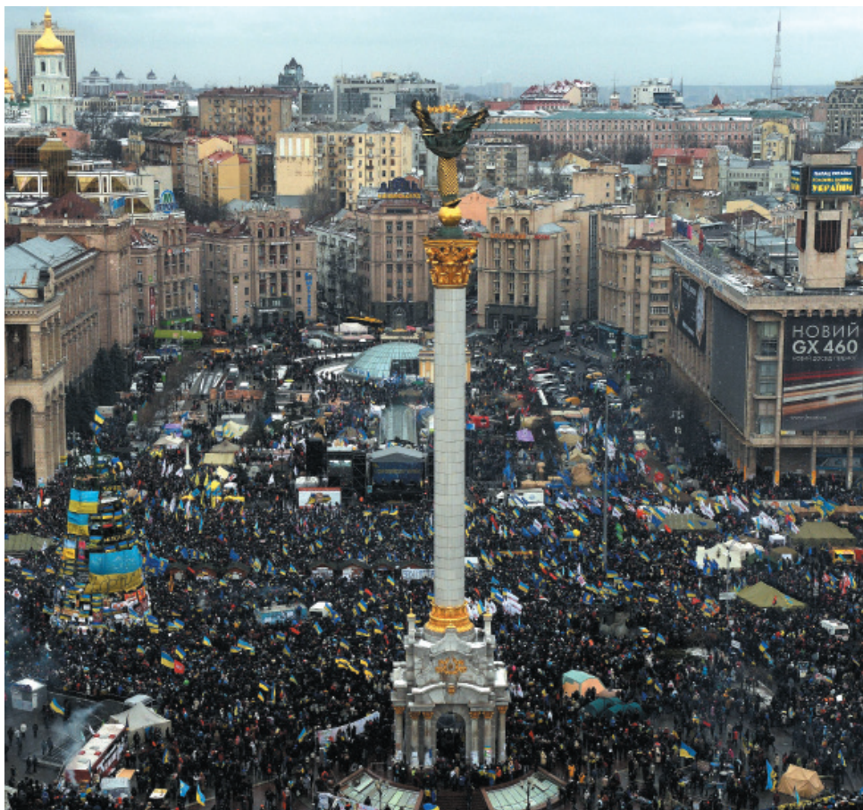
«Народне віче» — мітинг на Майдані Незалежності, Грудень, 2013 р.

■ Демонстрація — масовий марш як публічне вираження соціально-політичного настрою. Учасники демонстрацій виготовляють плакати, банери із гаслами, закликами, вимогами, а також вигукують їх під час проходження по вулицях.