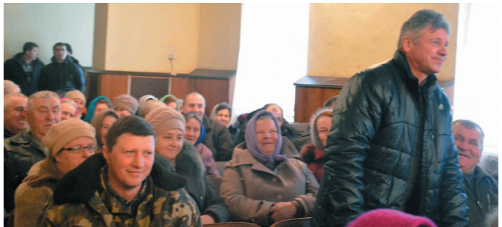
Загальні збори громадян смт Понорниця Коропського району Чернігівської області. Березень 2018 р.