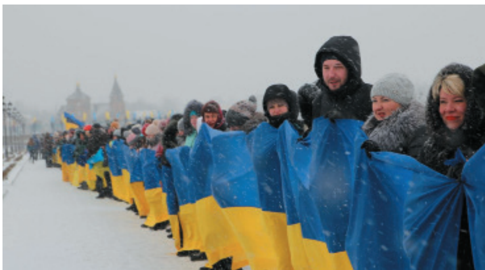
«Живий ланцюг» Соборності. Бахмут, 22 січня 2018 р. Фото: Микита Луцький. https://www.radiosvoboda.org/a/donbass-realii/28989981.html