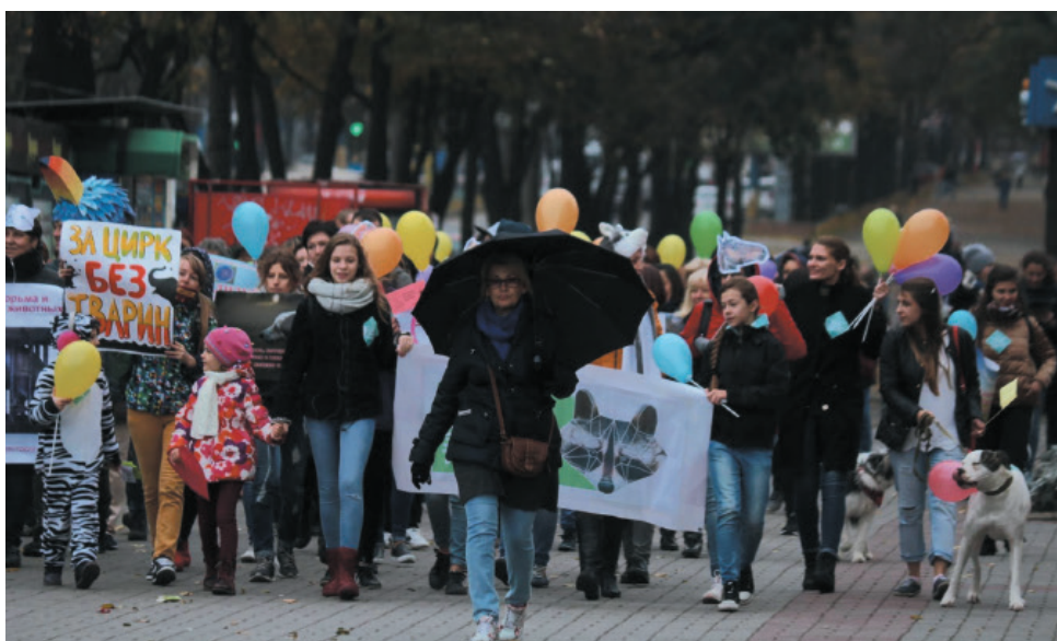
Демонстрація-марш за права тварин у Запоріжжі 15 жовтня 2017 р. https://www.061.ua/news/1828046