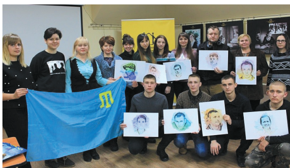
Акція на підтримку в'язнів Кремля (#26SOLIDARITY) у Чернігові. Лютий 2018 р.