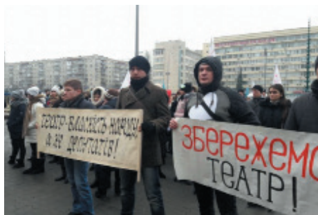
Пікет акторів Київського обласного драматичного театру з вимогою виплати зарплати, грудень 2017 р.

■ Інші форми мирних зібрань: сидячі демонстрації і протести, факельні процесії, мовчазні марші, «людські (живі) ланцюги», вело-, мото- та автопробіги, музичні чи театралізовані вистави і паради тощо.