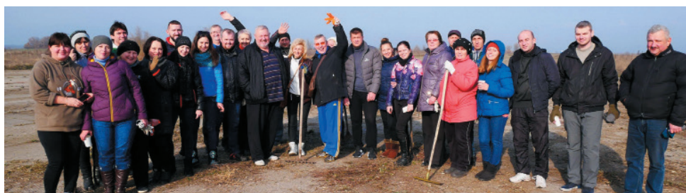
Члени Широківської об'єднаної територіальної громади (Запорізька область) на спільній акції. Квітень 2017 р.

Діємо , навчаючись проводити мирні зібрання громадян.